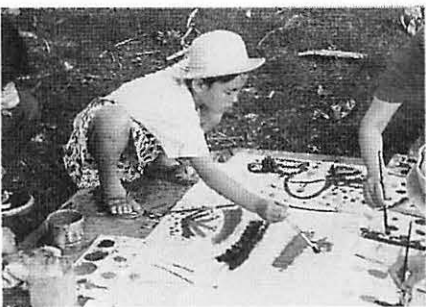
表紙デザイン 中井 幸一