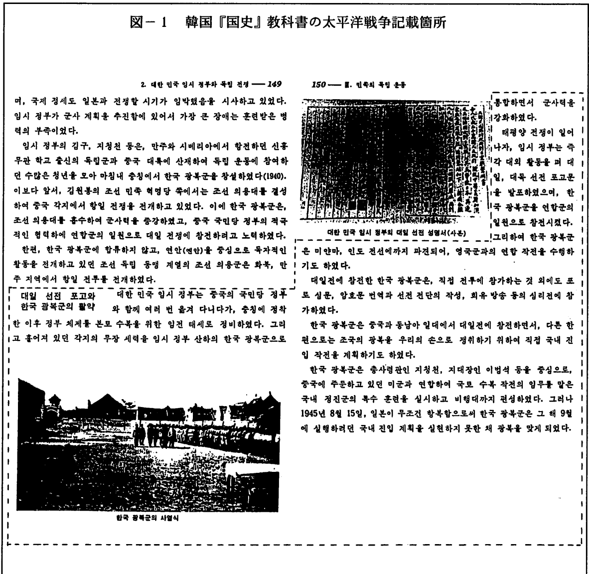
図-1 韓国『国史』教科書の太平洋戦争記載箇所

宋の調査では太平洋戦争という言葉が『国史』に出てくるのはたった一箇所、それも「対日宣戦布告と韓国光復軍の活躍」という項目の一部にすぎない。長文だが比較の基本となるため、この項目の内容の翻訳文を全文紹介する。あわせて、メディア・リテラシーとしての特性を確認するため、『国史』の該当部分を図1として示しておきたい。なお、図1の点線で囲った部分が以下の翻訳文の該当箇所である 4) 。